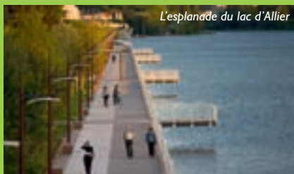
L'esplanade du lac d'Allier

À partir de 1960, un vaste programme d'investissements est lancé afin de diversifier les activités de Vichy et de créer de nouveaux pôles d'attraction, anticipant le déclin relatif du thermalisme traditionnel. Avec le Centre omnisports et son vaste plan d'eau, Vichy devient la ville du sport. Dans les années 90 d'importants travaux transforment et modernisent le cœur de ville : un grand secteur piétonnier met en valeur les commerces ouverts 7 jours sur 7, un palais des congrès au cœur d'un monument historique, 2000 chambres d'hôtels du 2 au 4 étoiles, des thermes rénovés, un spa relié à un hôtel 4 étoiles, un opéra de 1400 places ouvert toute l'année, un pôle universitaire créé sur la friche d'anciens établissements de bains, le Grand Marché, le quartier de la gare et l'esplanade du lac d'Allier sont réhabilités. Ces grands aménagements urbains mettent en valeur le patrimoine architectural et écologique de Vichy, accroissant son attractivité, jusqu'à la faire devenir la deuxième agglomération d'Auvergne.