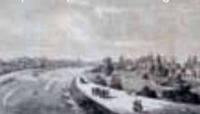
Le parc Napoléon III et la digue